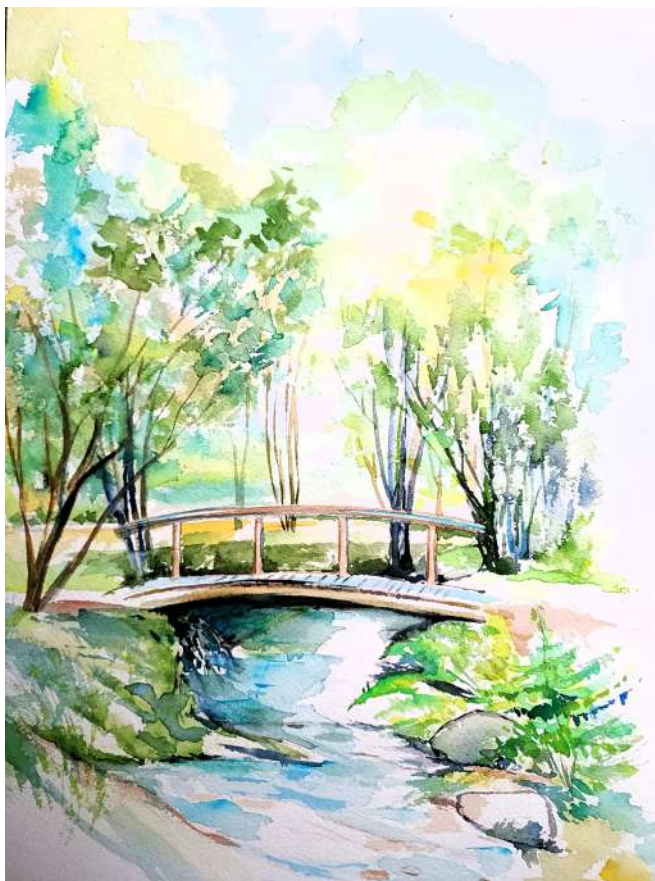
Aquarelle : Catherine Sylvain

■ La commune a candidaté auprès de la région Bretagne aux lendemains des incendies des Monts d'Arrée en été 2022, pour un projet sur l'eau, intitulé « petit patrimoine de la commune au fil de l'eau ». La sécheresse nous avait alors frappé dans un paysage considéré comme « le Château d'eau de la Bretagne ».